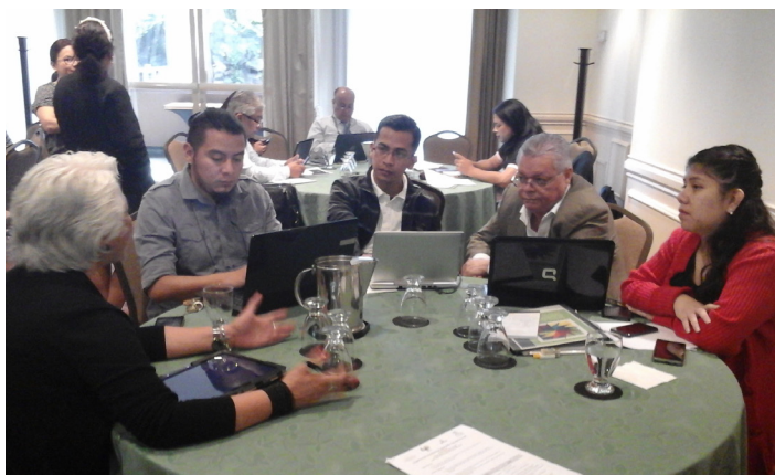
Revisión de los ítems de la herramienta MECAT en los grupos de trabajo

La herramienta MECAT hace una evaluación en una escala de 1 a 10, considerando 10 como una fortaleza y 1 como debilidad.